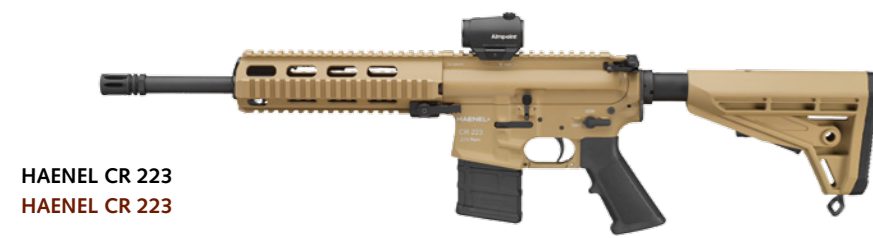
HAENEL CR 223 HAENEL CR 223

The Haenel CR 223 is a semi-automatic rifle in calibre .223Rem., which experienced functional revisions, exceeding the AR-15/M4 standards. Also available in the extremely durable and resistant Ilaflon coating in the colour "green-gray / RAL7013".