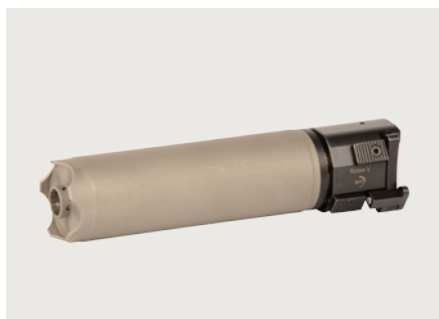
Schalldämpfer Rotex V Compact Schnellfeuereigneter Schalldämpfer mit Aufnahme NATO A2 für Mündungsfeuerdämpfer. Suppressor Rotex V Compact Rapid fire approved suppressor with NATO A2 mount for muzzle flash suppressor.