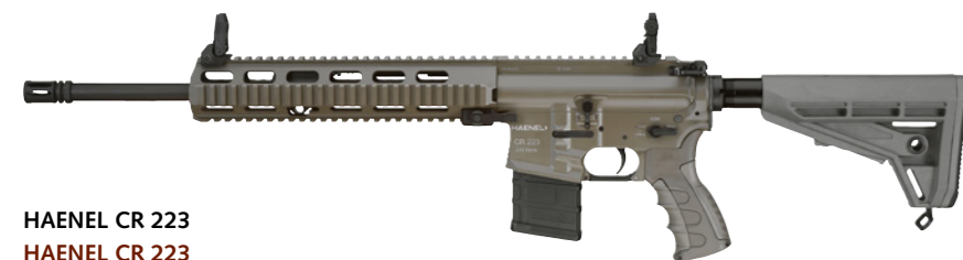
HAENEL CR 223 HAENEL CR 223

Die Haenel CR 223 ist ein halbautoamtisches Gewehr im Kaliber .223 Rem., das über den AR-15/M4-Standard hinaus wesentliche funktionelle Überarbeitungen erfahren hat. Auch erhältlich mit der extrem abriebfesten und unempfindlichen Ilaflon-Beschichtung in der Farbe „Steingrau-Oliv / RAL7013“.