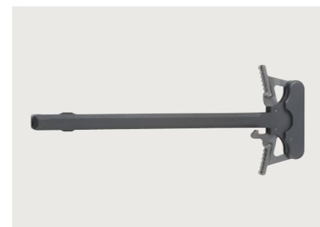
Beidseitig bedienbarer Durchladehebel Optional für Sportschützen. Ambidextrous charging handle Optionally for sport shooters.