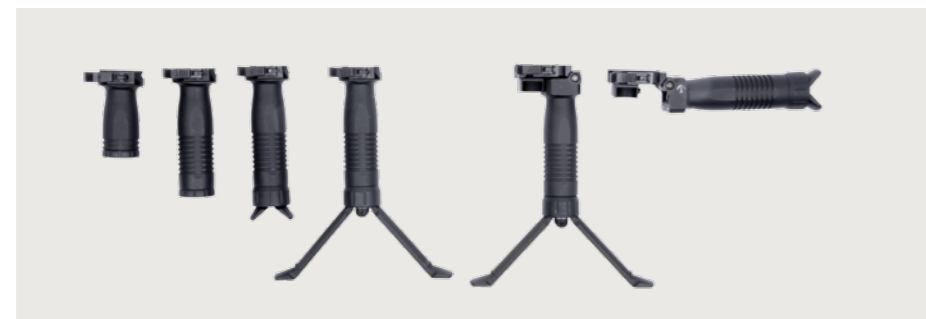
Handgriffe Handgriffe in unterschiedlichen Varianten für die Montage am Handschutz (NATO-Rail-Aufnahme). Grips Grips in different variations for mounting on the hand guard (NATO-rail-mount).