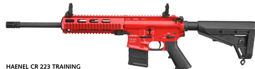
HAENEL CR 223 TRAINING HAENEL CR 223 TRAINING