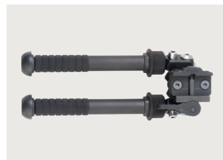
Atlas Zweibein Höhenverstellbares Zweibein mit NATO-Rail-Aufnahme. Atlas Bipod Height-adjustable bipod with NATO-rail-mount.