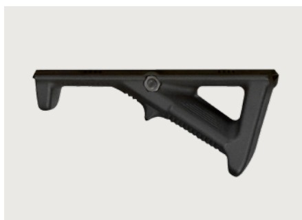
Abgewinkelter Handgriff Handgriff für die Montage am Handschutz / NATO-Rail-Aufnahme. Angled handgrip Handgrip mountable on the hand guard / NATO-rail-mount.