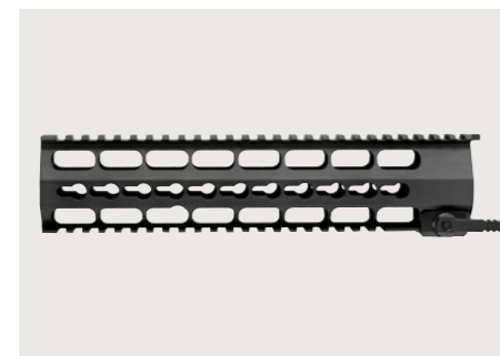
Handschutz mit NAR 4694 und KeyMod Werkzeuglos montierbar / mit zwei NAR 4694 Schienen. KeyMod hand guard Mountable without tools / equipped with two NAR 4694 rails.