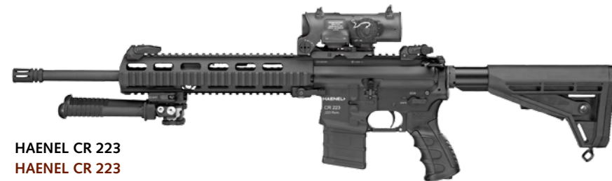
HAENEL CR 223 HAENEL CR 223