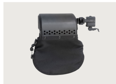
Hülsenfangsack Hülsenfangsack zur werkzeuglosen Montage am Handschutz. Brass catcher A bag to catch cartridge cases, mountable without tools.