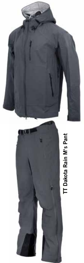
TT Dakota Rain M's Pant